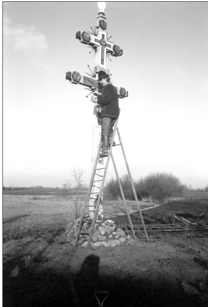
Крыж у Чэхах. Рабочы момант аздабленьня крыжа.

„У сэмінарыю я прыхаў на пачатку ліпеня. Адрозьніваю ў храм, дзе здзівіўся, убачыўшы ўнікальныя абразы. Увогуле, усе храмы там бабудаваны ўніятамі. Прайшоўся па манастыры. Са мной быў сэмінарыст зь Берасьця. Спытаў яго, як ён пачуваецца ў Жыровіцкім