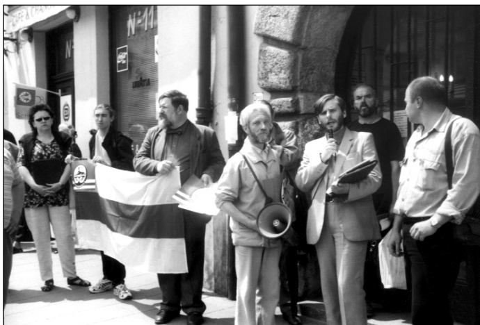
Кракаў. 3-га ліпеня 2000 г. Дэманстрацыя Камітэту „Польшча-Беларусь” перад кансулятам ЗША, супраць расейскай імперскай палітыкі ў Беларусі і Чачэніі. Патрабаваньні стьніць данамогу Амэрыкі для Расеі.

рэжыму беларуская культура ёсьць першы вораг. Бо ў грунце справы — рэжым ваюе супраць беларускай нацыі.