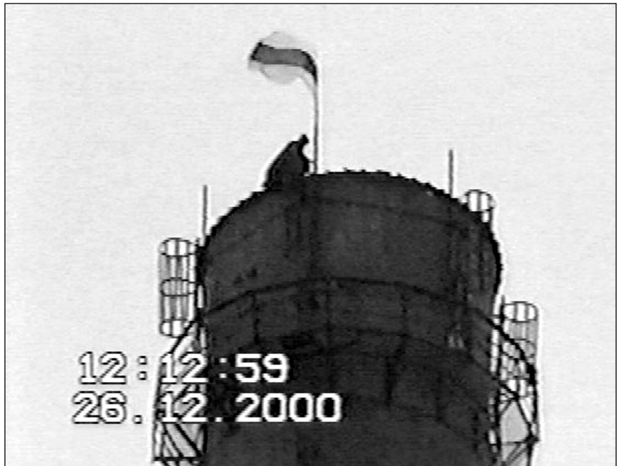
Мірон у вышыні. 26 сьнежня 2000 г.

Сутнасьць у тым, што ў Казахстане не было рэальнай палітычнай альтэрнатывы. Калі няма альтэрнатывы, то тым, хто галасаваў супраць дыктатара, няма да каго апэляваць, няма каго супрацьстаўляць, няма свайго выбару, няма прычыны і фігуры, каб кансалідаваць барацьбу і прад’явіць канструктыўныя прэтэнзіі фальсіфікатару.