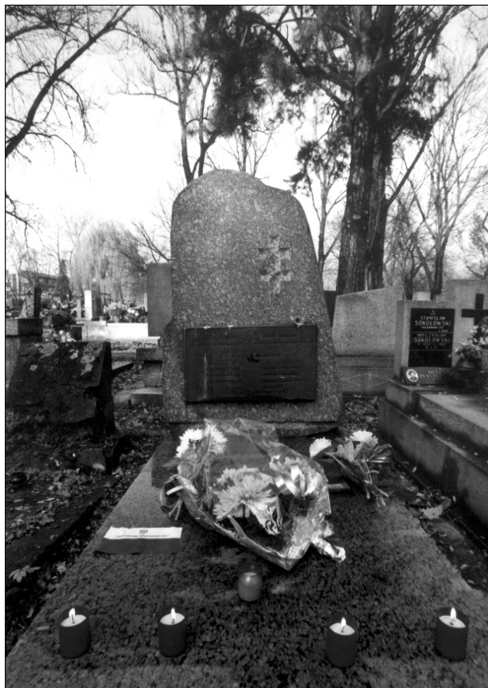
Магіла Алеся Гаруна на Ракавіцкіх могілках у Кракаве.

Ю.Сьвірко: „13.05. Я бачу каля 5 тысячаў удзельнікаў. Сьцягі... беларускія песьні. Спакойна. Палкоўнік Саланец вядзе прыяцельскія