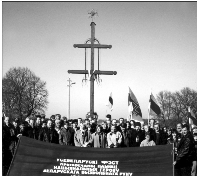
Удзельнікі Ёсебеларускага Фэсту, прысьвечанага памяці нацыянальных герояў Беларускага Вызвольнага Руху 1863-1864 гг.