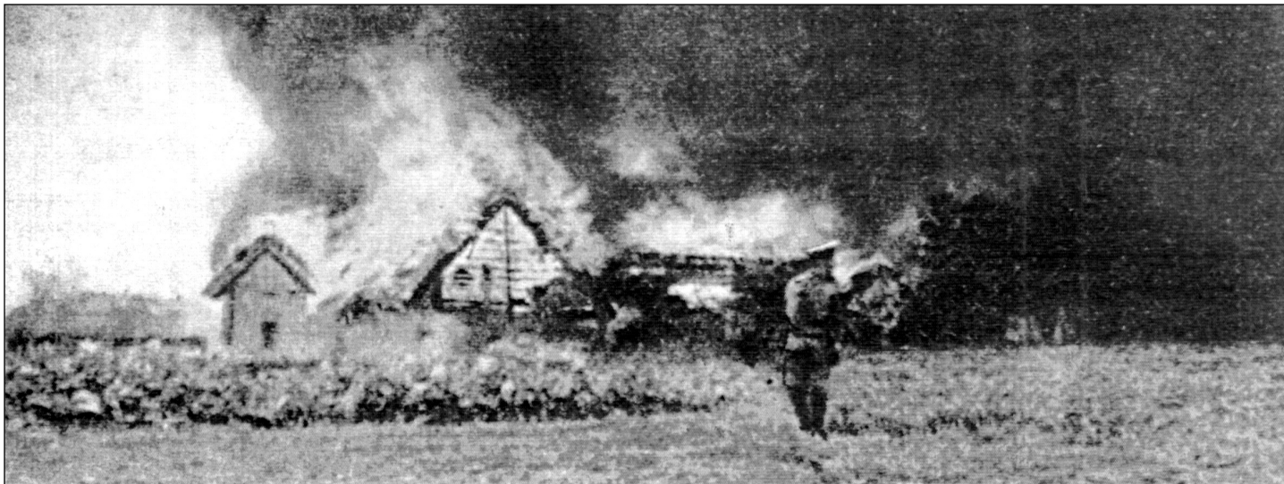
Першая Сусветная вайна. Расейцы, адступаючы, паліць беларускую вёску.