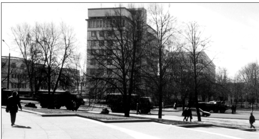
Менск. Пейзаж з браневіком.

2 красавіка, Віцебск. Скончыўся судовы працэс у Кастрычніцкім райсудзе па факце несанкцыянаванага моладзевага прагэсту супраць