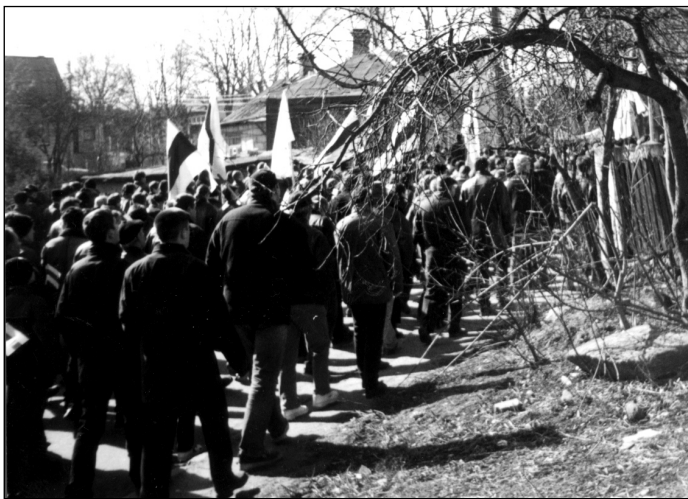
Дэманстрацыя ў Горадні.

3 красавіка ў Маскве трое актывістаў Маладога Фронту і некалькі прадстаўнікоў маладзёвых дэмакратычных расейскіх арганізацыяў правялі пікетаваньне Дзярждумы. Пікетуючы трымалі ў руках Бел-Чырвона-Белыя сьцягі і плякаты ў абарону незалежнасьці Беларусі і