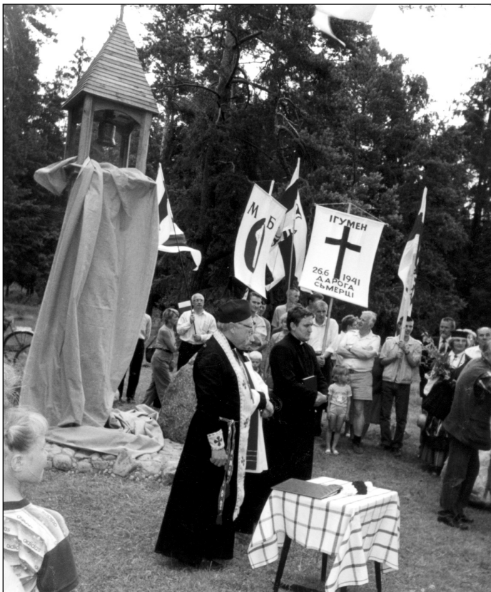
Іумен. Адкрыццё капліцы ў памяць пра расстраляных.