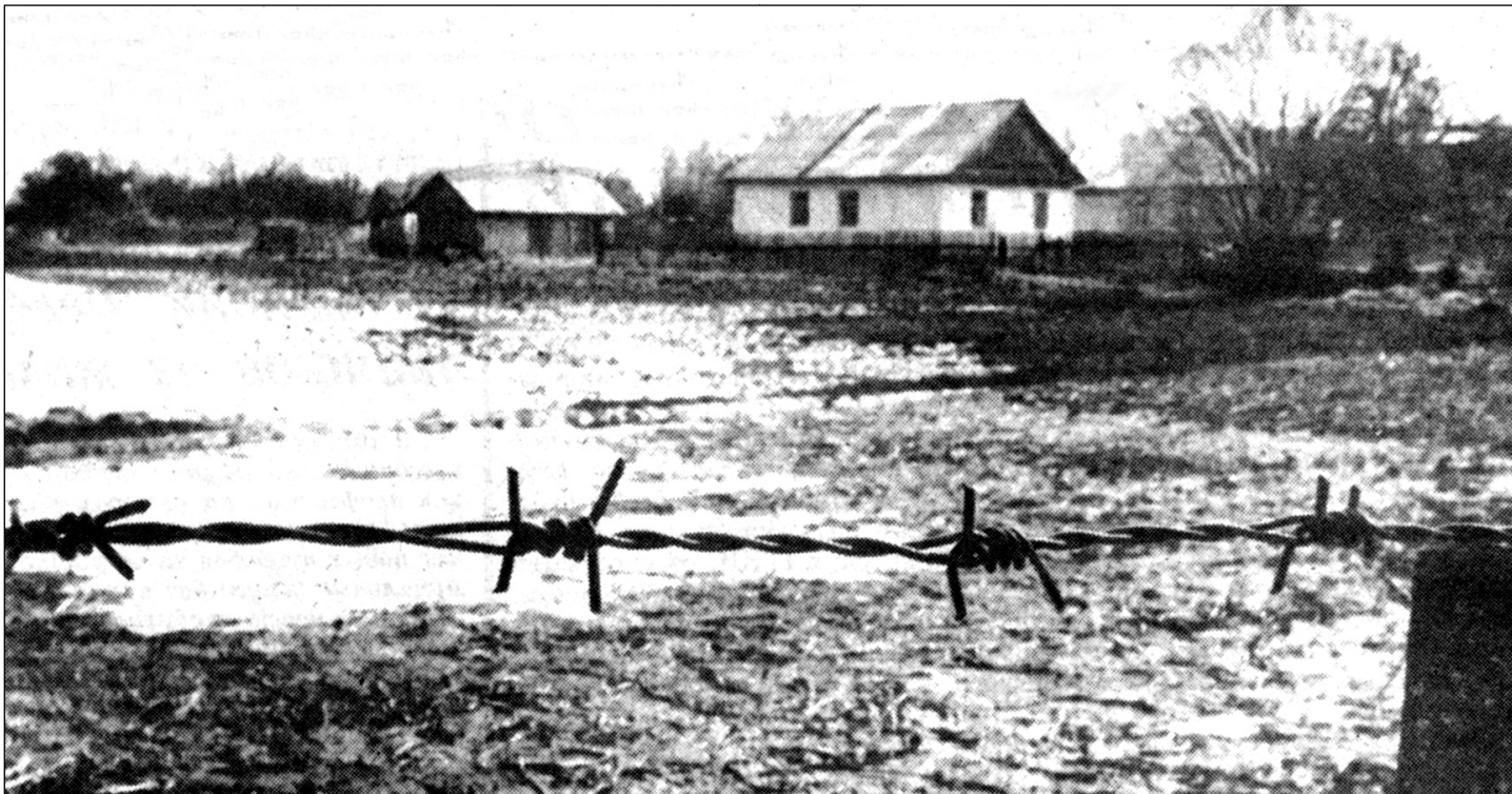
Радыяцыйная зона на Гомельшчыне. Тут жылі беларусы.

адкрыта выступілі барысаўскія жанчыны і мужчыны. Група асобаў арганізавала пікет. Усіх арыштавалі і судзілі.