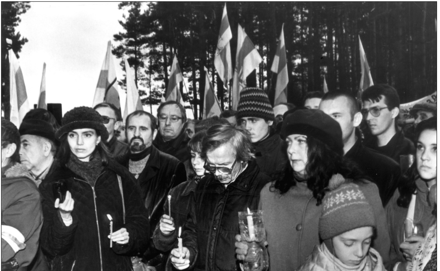
Кураты. Беларусы перад памяццю пра генацыд.

беларускага права і свабоды, пазьбегнуць вынішчэння і ліквідаваць Чарнобыльскую вайну немагчыма.