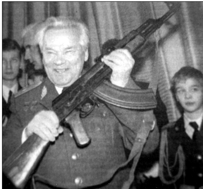
Расейцы сьвяткуюць юбілей аўтамата.

Нягледзячы на запалохваньні рэжыму і абяцаньні расправы за збор у цэнтры Менску, больш за 500 асобаў а 12-й гадзіне сабраліся каля плошчы Незалежнасці і ўзьнялі Бел-Чырвона-Белыя сьцягі . Калі