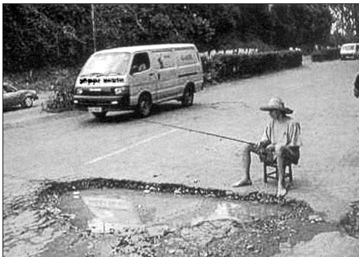
„Абы вайны не было.”