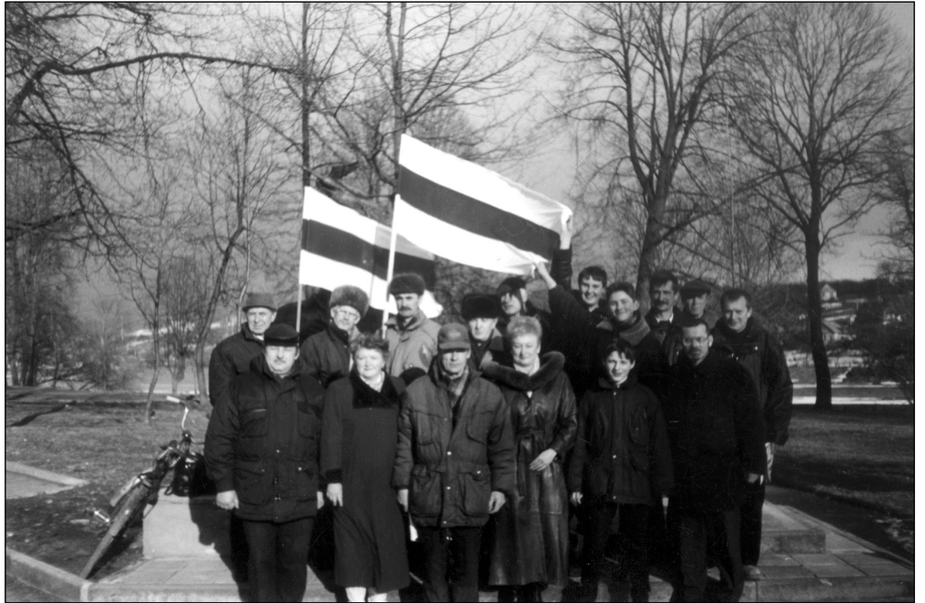
Арыянскія абрадэжэнцы. (Група Кансэрватыўна-Хрысьціянскай Партыі — БНФ)

1 чэрвеня суд Цэнтральнага раёну Менска вынес завочнае рашэньне ў адносінах да маладзёна Ц. Дранчука — арышт 15 сутак (за ўдзел у акцыі 25 Сакавіка — арт.167.1 КаАП). Згодна заканадаўства, справы па названым артыкуле разглядаюцца толькі ў прысутнасьці правапарушальніка. Па факце парушэньня заканадаўства накіраваньня скарга на імя старшыні Менскага гарадзкага суда і заява пракурору Цэнтральнага раёну Менска.