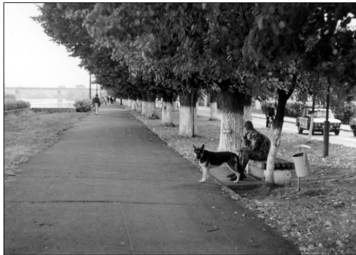
Пінск. 2001 год. Крайвід зь міліцыянерам.

Intimidation and repressions dominated all the stages of the electoral campaign. Regime has violated all the norms of the actual laws and international democratic norms. Representatives of the opposition political parties and NGOs were not included into the central and local electoral commissions. Police and KGB officers attacked and arrested the collectors of signatures which supported the alternative candidates. State mass media supported only one candidate – Lukashenka. Editorial offices and publishing houses of the independent mass media have been exposed to police repressions. Regime blackmailed and provoked the opponents. Lukashenka has mobilized the whole state structure to carry out the frauds: police and procurator’s offices, special services, nomenclature of the executive power, directors of the enterprises and institutions. They used the tactic of intimidation and economic methods against their staff. On September 4 has been started the „preliminary voting”. Electoral frauds became extraordinarily systematic. This was a forced voting. During the work-time the people was transported in special busses to the polling-stations in order to secure a high percentage of the preliminary voting. Using this system the administration has secured in different regions results of the preliminary voting until 60% of the general