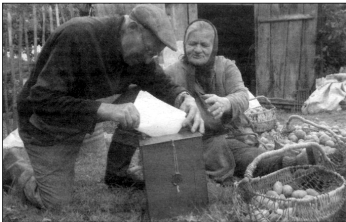
Так зьянае „папярэдняе галасаваньне“. „Выязную“ скрыню прывезьлі на вёску да дзедкі з бабкай.

Асноўны ўдар рэпрэсіўнай машыны рэжым ськіраваў супраць актывістаў Кансэрватыўна-Хрысьціянскай Партыі — БНФ . Сяброў