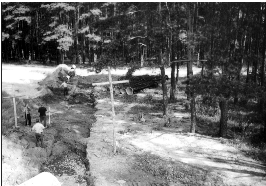
Фронтаўцы, змагары за Курапаты, засыпаюць водаадводны роў.

30 траўня сябры Кансэрватыўна-Хрысьціянскай Партыі — БНФ у чарговы раз сабраліся каля помніку Янку Купалу ў Менску, каб працягнуць традыцыйныя паэтычныя чытаньні, прысьвечаныя 120-м угодкам вялікага песьняра. Чыталі вершы, сьпявалі песьні, гаварылі пра жыццядайнасьць паэзіі Купалу, трагізм ягонага жыцця.