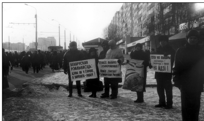
Менск-2003. Зімовым халодным днём.