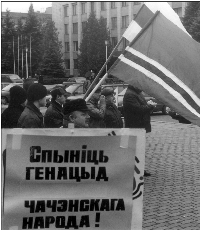
Дэманстрацыя ў Пінску

прамаскоўскага рэжыму Лукашэнка на ўсіх ягоных узроўнях. Але таксама гэта сведчыць пра тое, што рэжым баіцца народнага супраціву расейскай агрэсіі ў Беларусі.