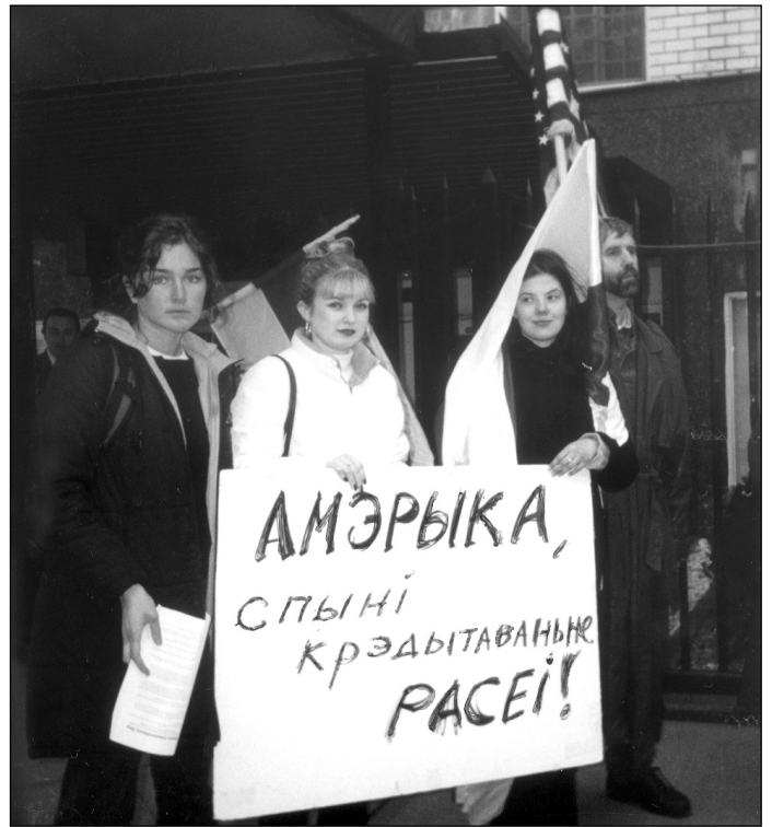
Беларусы ў Нью-Ёрку