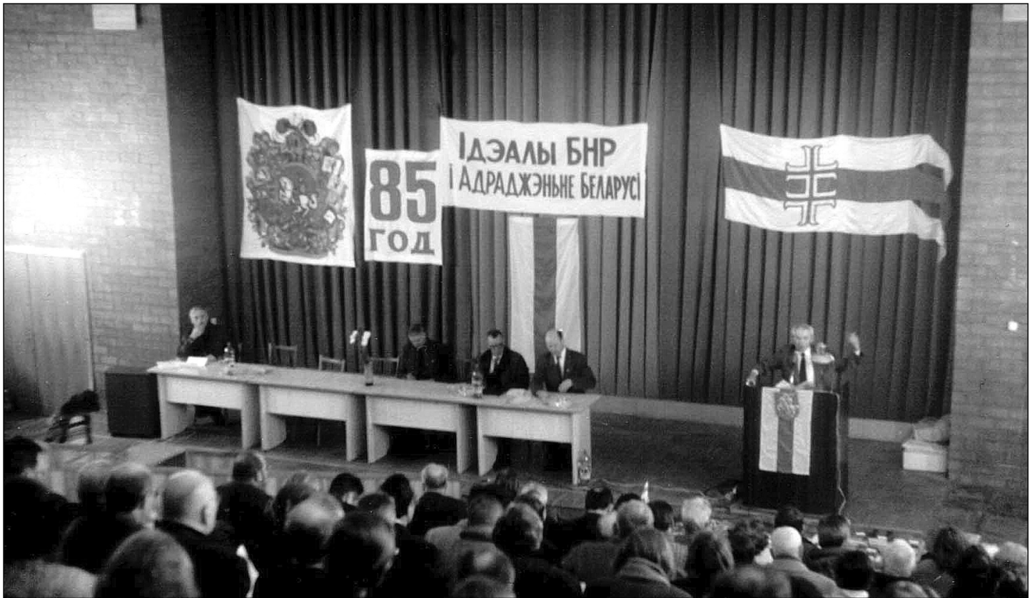
Канфэрэнцыя „Ідэалы БНР і Адраджэньне Беларусі”. Менск, 2003г.

рубля плянуецца, маўляў, толькі з 1 студзеня 2005 г., а таксама за развагамі „экспэртаў” пра выгоду альбо невыгоду ад увядзеньня безнаўнага расейскага рубля рэжым не можа схаваць свае антыдзяржаўныя дзеянні. Беларускі народ рэальна расплочваецца матэрыяльнымі рэсурсамі за антыдзяржаўную палітыку. Пры ўвядзеньні расейскага рубля беларусы дадаткова мусяць аплочваць расейскую карупцыю, войны і ўзбагачэньне алігархаў.