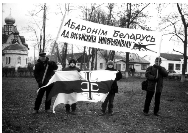
Фронтаўцы на Слуцчыне

The leadership of the Belarusian Popular Front „Adradzennie” and of the Conservative Christian Party — BPF Minsk, March 14, 2003 (Пераклад зь беларускай мовы на ангельскую Валеры Буйвал)