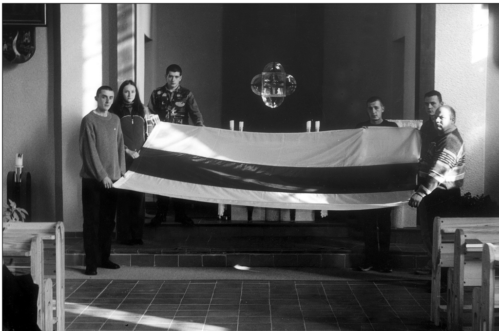
Асьвячэньне Сыюза ў касцёле на Пішчыне.

У час сьмяротнай небясьпекі для нацыі я адчуваю надыход сьветлага Адраджэньня Вялікай Беларусі. Можна, гэта здасца каму неабгрунтаваным, але я не магу не сказаць, што чую ў сваёй душы.