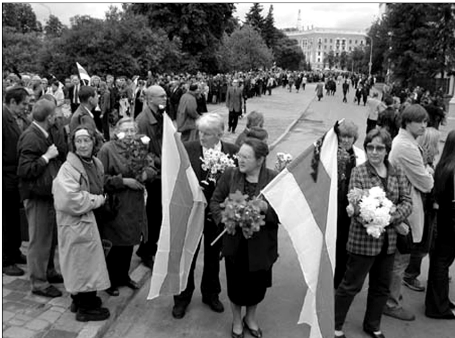
Развітаньне з Быкавым.

Шэрасьць прымітыўная. Стараючыся прынізіць лепшых, яна імкнецца ўзвысіць сябе і пачынае маніпуляваць імям вялікага (то „забываецца” ягонае прозьвішча, то перакручвае імя, то ня той націск, то ўдае няведаньне, як завуць і г.д.). Шэрасьць у гэты момант жыве ілюзіяй, быццам сьвет мераецца па ёй (маўляў, калі яна ня ведае, хто такі Арыстоцель, то які там яшчэ Арыстоцель). Шэрасьць