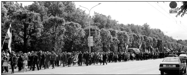
Працэсія. Пахаваньне Быкава.

■ Звычайна ў Менск не прыязджаюць прэзыдэнты цывілізаваных краінаў. У Арменіі вельмі старажытная цывілізацыя, але цяперашняя халопская