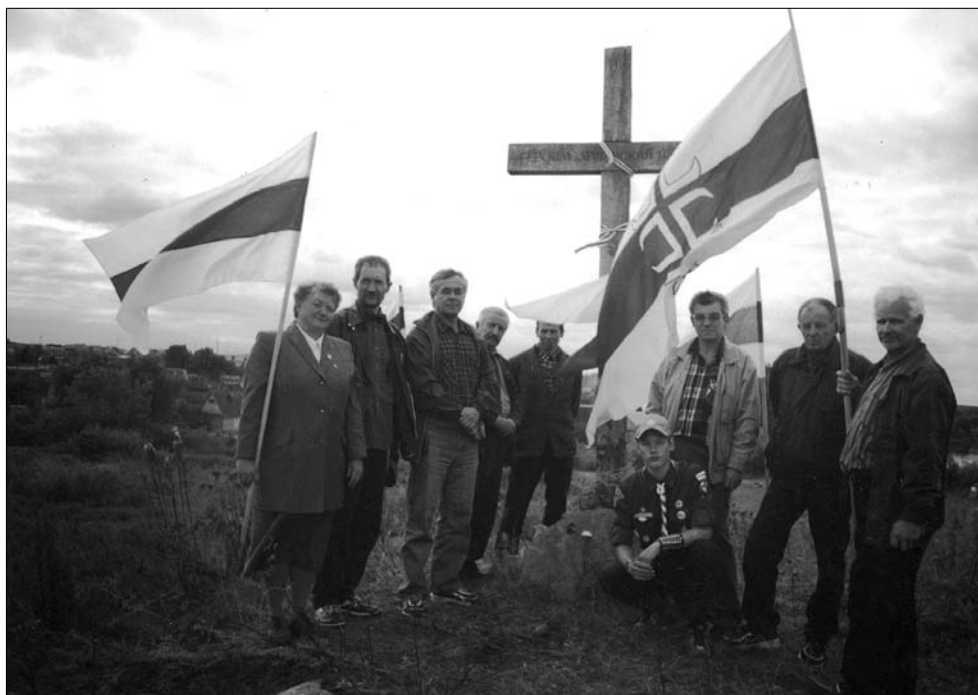
Фронтаўцы на Крапіўным полі над Воршай. 2003 г.

моцныя, што не дазваляюць бачыць відавочнае. Беларусы дванаццаць гадоў ня могуць усьведаць, што сталі ахвярай новага віду вайны — захопу ўлады знутры крэатурай чужой дзяржавы празь дзейнасьць спэцслужбаў разведкі. Зьнішчылі гэрб і сьцяг, зьнішчылі кнігі, беларускую школу, нацыянальнае тэлебачаньне, радыё, мову, дабіваюць культуру, далі прыярытэтныя правы чужому насельніцтву, плююць і рагочуць проста ў твар, а беларусы яшчэ нічога не разумеюць, што сталася і што адбываецца. Некаторыя нават радуюцца, думаюць — дожджык ідзе. Нешта аналягічнае адбываецца ў Эўропе. Эўрапейскі нэакаляніялізм пайшоў у адваротным кірунку. Калёніі займаюць тэрыторыі былых мэтраполіяў і стыхійна, крок за крокам, мэнтальна і дэмаграфічна падпарадкоўваюць стары кантынэнт, застаючыся сабой. Дэградацыя інтэлекту лібэральнага эўрапейскага сьвету зайшла настолькі глыбока, што ніхто зь іх ня здольны ўжо рэальна і адекватна думаць пра эўрапейскую будучыню, ці хоць бы ўявіць, што іх чакае. Яны паўтараюць свае хімы пра „культураўнае” ды шматрасавае грамадства, пра фальшывыя „правы чалавека” і гавораць пра новы Бабілён, афіцыйна адмаўляючыся ад хрысьціянства, ад хрысьціянскай культуры, ад нацыянальных традыцыяў і нават ад гісторыі. Усё выглядае неверагодна і