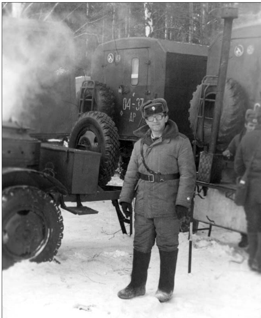
1983 год. Армейская вучэбка.

Жыў ў медпункце, прымаў і выдаваў медыкаменты, лячыў хворых, правяраў сталовыя. За гадзіну да „прыняцця ежы” я абавязаны быў прысьці, паспытаць, ацаніць якасьць, правярыць санітарны стан і расьпісацца