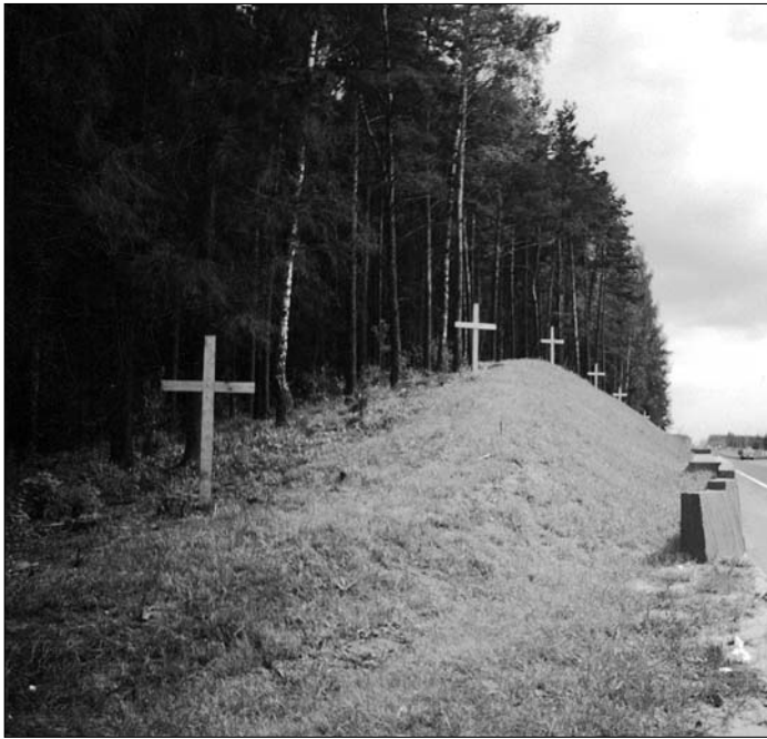
Курапаты ад акружнай дарогі. 2003 г.

Так, гэтая праца вельмі вялікая. Хаця ня так проста ўсё. Лаўку Клінтана ламалі некалькі разоў. Але Крымінальная справа ўзбуджаная. Міліцыя пачала назіраць за Курапатамі. Адносіны да самой праблемы лепшаюць. І нашая пастаянная прысутнасць, і прысутнасць крыжоў, і прысутнасць (з нядаўняга часу) міліцэйскага патруля прывялі да таго, што зараз, фактычна, няма шашлычнікаў. Туды ўжо не заходзяць ні піць-гуляць, ні шашлыкі рабіць. У мікрараёне Зялёны Луг жыхары ведаюць пра Мэмарыял, змяніліся псіхалагічныя адносіны да гэтага месца. Нармальных людзей, у якіх нармальная псіхіка, крыжы абавязваюць, засьцерагаюць ад лёгкадумства, спыняюць. Ім ужо зразумела, што сюды ісьці піць-гуляць нельга.