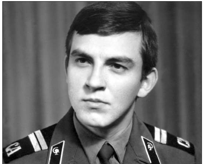
1978 год. У савецкім войску.

Ад савецкай арміі на тэрыторыі Беларусі засталася шмат забруджанага месца: і паліва, і палігоны. Але самае асноўнае забруджаньне Беларусі — гэта варожае нам беларусам расейскае афіцэрскае. Гэта 5-я калёна, якая ніколі ня будзе дбаць пра незалежнасць Беларусі, бо ня лічыць беларусаў за людзей (як і ўсіх астатніх акрамя расейцаў). Гэтая група ненавідзіць Беларускую дзяржаву, яе мову і культуру.