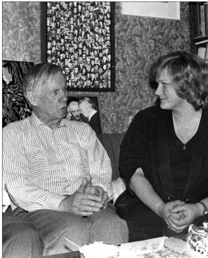
Васіль Быкаў, Галіна Пазыяк, 1996 г.