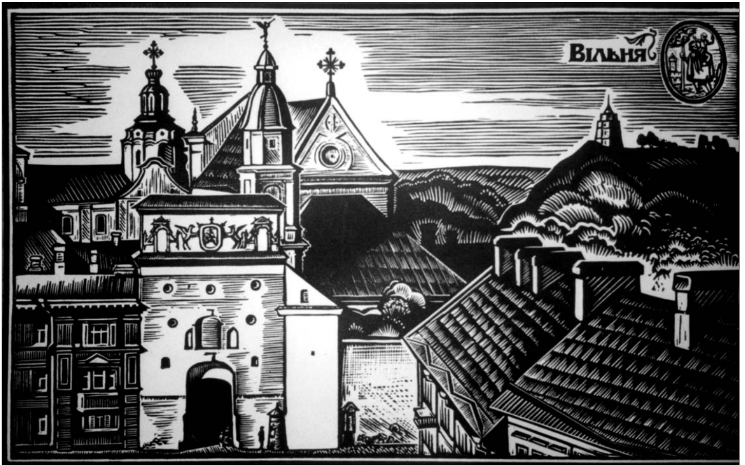
13. Вільня. Вострая брама. Лінагравюра М. Купавы.

На выставе прадстаўлены вядомыя працы мастака, пасьвечаныя мясьцінам і вобразам вялікіх беларускіх песняроў, выкананыя ў тэхніцы каляровай і чорна-белай літаграфіі, абразной гравюры (лінарыты) і акварэлі. Сярод іх вядомы партрэт маладога Якуба Коласа (лінарыт, 1982 г.), які, без перабольшаньня скажу, увайшоў у фонд клясыкі беларускага мастацтва. Тут жа выдатны партрэт Янкі Купалы, выкананы ў кантрастным плякатным стылі, панарама Вязынкі, хутар Аконы, памятнаы мясьціны ў Вільні і Менску, зьвязаныя з гісторыяй і культурай Беларусі.