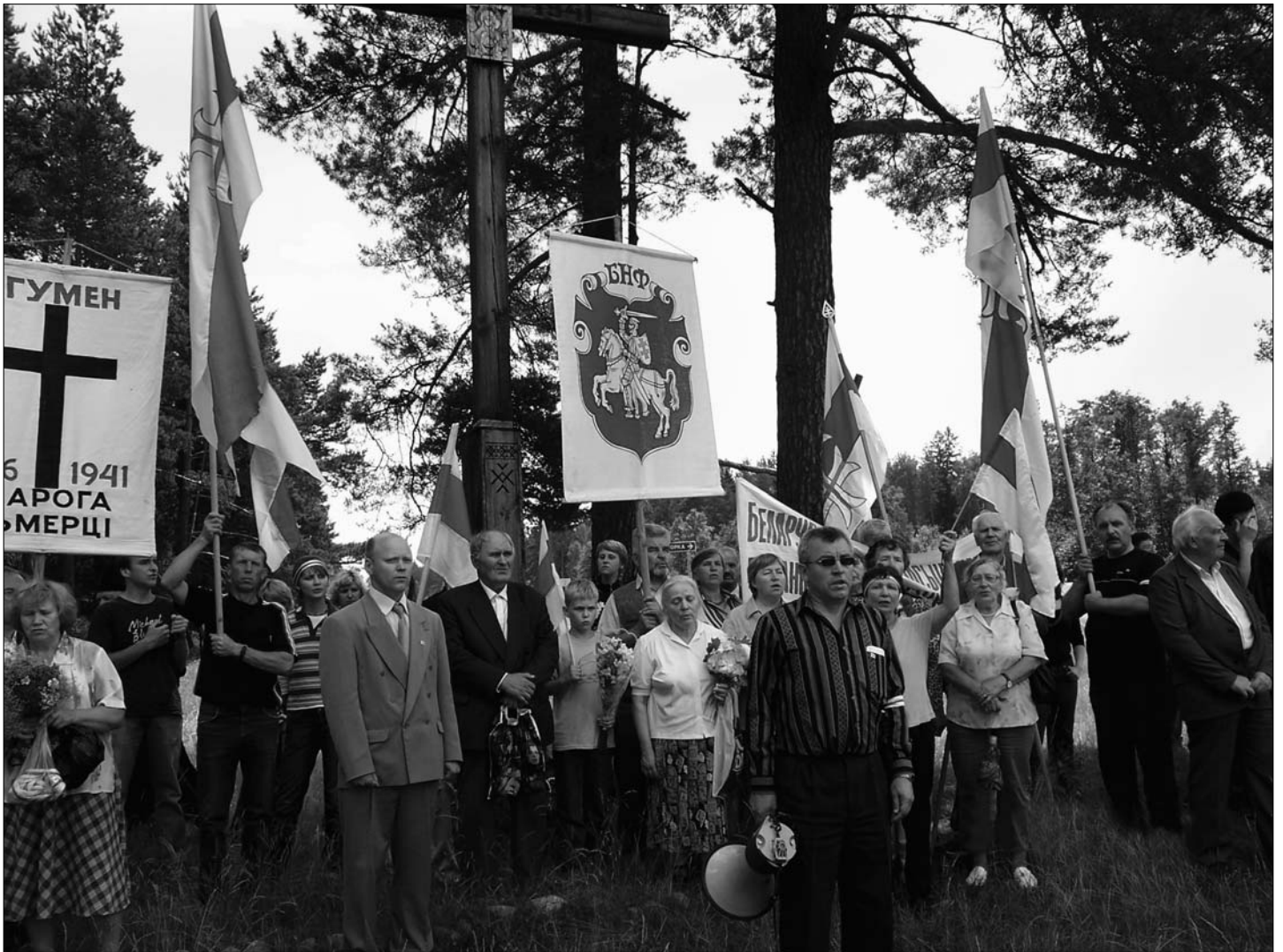
12. Ігуменскі шлях. Адраджэнцы на месцы расейскіх растрэляў. 2007 г.