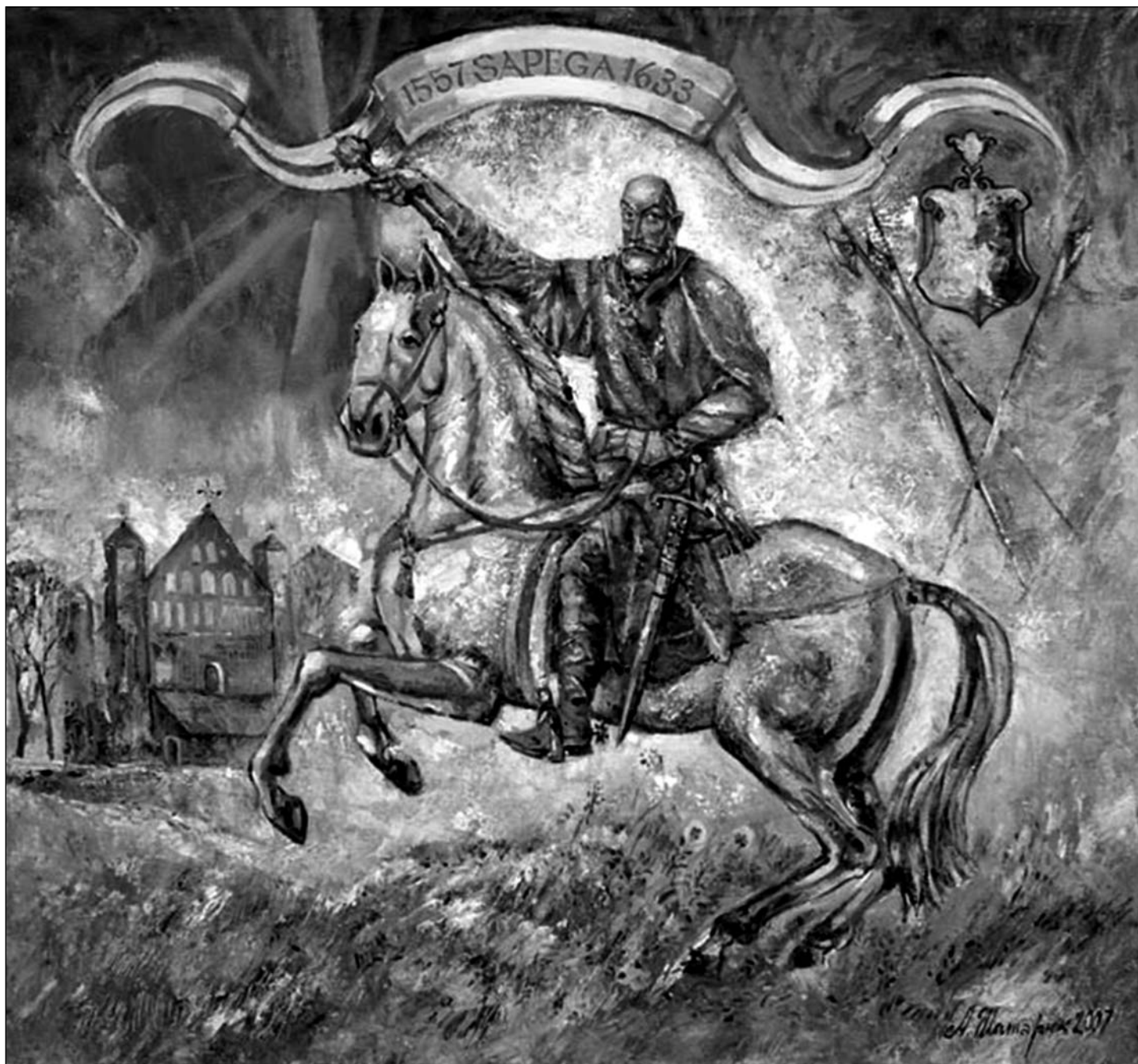
1. Капіцлер ВКЛ Леў Сапега. Новая карціна (алеі) Алеся Шатэрыніка, напісаная ў гонар 450-годдзя з дня нараджэння вялікага беларускага дзеяча. Прэзентацыя твора адбылася 19 жніўня ў Нью-Ёрку ў беларускім саборы святога Кірылы Тураўскага.

НЬЮ-ЁРК – ВАРШАВА, сакавік-жнівень 2007 г.