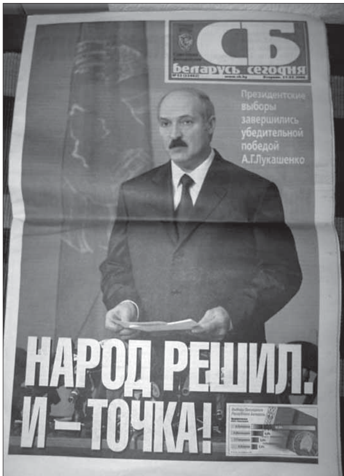
4. Трэці тэрмін: „Президентские выборы завершились убедительной победой Лукашенко” («Советская Белоруссия»).

доказы, угаворы, лісты, ськіраваныя да гэтае публікі, ня маюць сэнсу. (Мы ўсё гэта перажылі.)