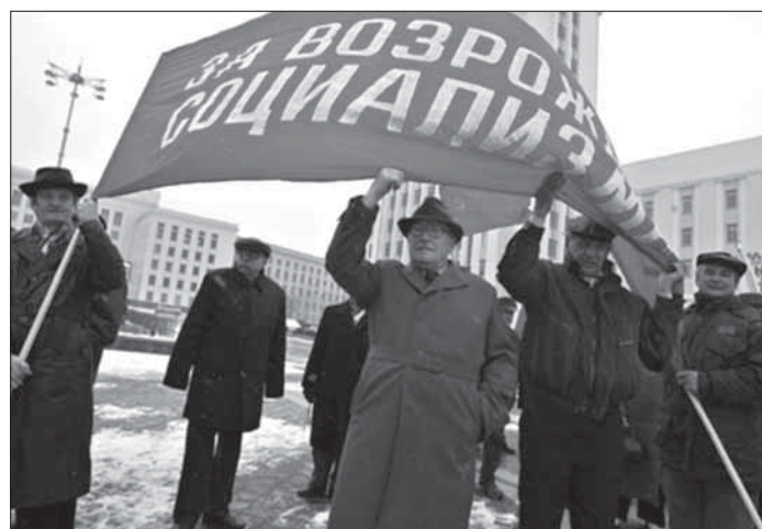
8. 2007 г. „За возрождение социализма”. Дэманстрацыя камуністаў на плошчы Незалежнасці ў Менску.

Заўважым, што калі гаворка ідзе пра адносна надзейна працуючыя АЭС (не расейскай вытворчасці), без частых аварыйных выкідаў, дык таксама існуюць даказаныя факты адмоўнага ўздзеяння АЭС на чалавека. Так у штаце Маса-чусэтс, было выяўлена, што ў людзей, якія працуюць і жывуць у дваццацімілевай зоне АЭС „Пілігрым”, каля Плімута, у чатыры разы вышэй захворванне лейкеміяй, чым звычайна. Павялічаная колькасць выпадкаў рака у зоне АЭС „Траян”, штат Арэгон. У паселішчы, каля брытанскага ядзернага цэнтра ў Селафілдзе, захворванне дзяцей лейкеміяй у 10 разоў вышэй чым па краіне.