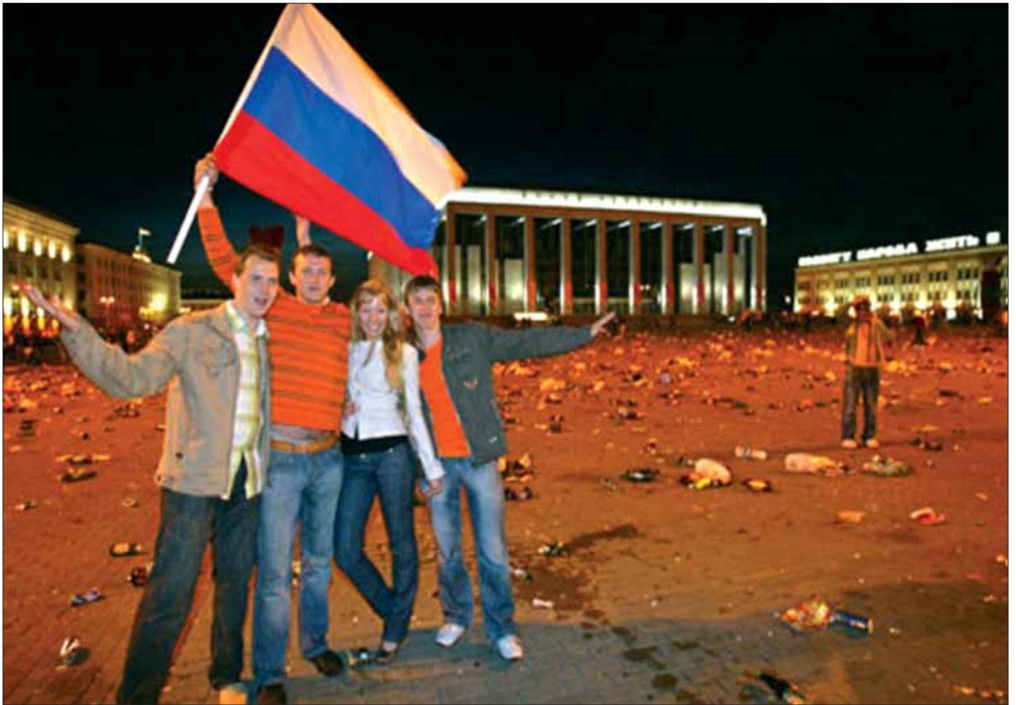
2. Паралельны сьвет альбо «русские прошли». Вось што пакінулі пасля сябе некалькі сотняў расейскіх (ці няхай сабе – „прарасейскіх”) аматараў футбола, што глядзелі матч „Расія – Іспанія” ля тэлеэкрана на Цэнтральнай плошчы Менска. Такога ў Менску не было за ўсю дакумэнтаваную гісторыю горада. Гэты здымак фота-журналісткі Юліі Дарашкевіч ( http://www.nn.by/index.php?c=ar&i=18037 ) успрымаецца як сымвал брыдоты і ўсяго таго што навалілася і адбываецца цяпер у Беларусі.