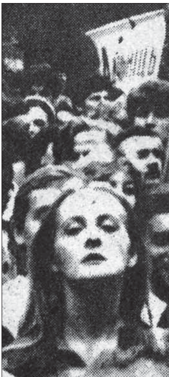
9. 1988 г. На першым мэмарыяльным мітынг у Курапатах.

дэмаралізацыю і дэзарганізацыю ворага быў памылковы. Немцам удалося самаарганізавацца і пачаць лютыя контраатакі. У наступныя дні ў Нідэрляндах высаджваліся амэрыканскія парашутысты і жаўнеры 1-й Польскай паветрана-дэсантнай брыгады генэрала Сасабоўскага, у якой служылі сотні беларусаў. Юнакі і мужчыны з заходніх вобласцяў Беларусі былі мабілізаваны ў Войска Польскае ў 1939 г., ваявалі супраць нямецкай інвазіі і адышлі з палякамі ў Францыю, а потым у Вялікую Брытанію. Другая частка беларусаў патрапіла на Захад у складзе польскай арміі генэрала Андэрска, вырваўшыся з Савецкага Саюза („нялюдскай зямлі”, як казалі тады беларусы) у 1942 г. Бітва за Нідэрлянды была адным з найбольш драматычных эпізодаў іхнага змагарнага шляху. Калі тысячы парашутыстаў апускаліся на зямлю, „немцы стралялі па нас, як па курапатах...” – успаміналі беларускія вэтэраны. У баях у раёне гарадоў Эйндховэн, Нэймэгэн і Арнхэм 1-я брыгада вызначылася сьмеласцю і рашучасцю, але панесла цяжкія страты. Рызыкаўны плян Мантгомэры, аднак, праваліўся. Парашутысты мусілі адбіваць нямецкія танкавыя атакі, маючы толькі лёгкую зброю. Захлынуўся і галоўны англа-амэрыканскі прарыў па дарозе на Рур. Праз тыдзень баёў пачалося адступленне паводле загаду хаўруснага камандвання. Упершыню за ўсю вайну пашкуматаныя часткі атрымалі загад не эвакуіраваць з сабой параненых. Настолькі вялікай была пагроза поўнага атачэння і знішчэння аддзелаў. Канчатковае вызваленне Нідэрляндаў адбылося толькі ў траўні 1945 г.