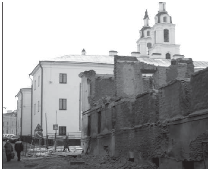
7. 2007 г. Разбурэньне старога Менска. Вуліца Бернардынская (Бакуніна). Справа руіны разбуранага антыбеларускімі ўладамі будынка 18-га стагодзьзя.

„У 2004 г., у Беларускага добраахвотнага таварыства аховы помнікаў гісторыі і культуры незаконна нацыяналізавалі на карысьць дзяржавы будынак, які быў адроджаны ў Траецкім прадмесьці за сродкі арганізацыі, як практычна і ўсе будынкi гэтага гістарычнага кварталу. У ў дзяржавы хапіла сумленьня зрабіць былога інвестара арандатарам, а зараз, у выкананні чарговага прэзідэнтскага ўказу па эканамічнаму знішчэньні грамадзянскай супольнасьці, з Таварыствам не працягнута дамова арэнды, і арганізацыі прапанавана 15.05.2008 г. да 15.00 пакінуць свае памяшканні.